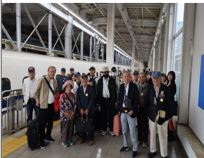
【いざ出発 新幹線/博多駅(10月22日)】