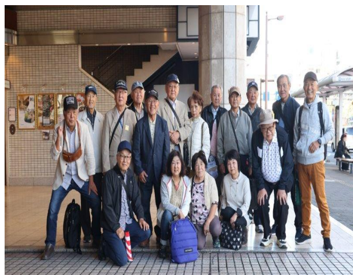
【新阪急高知H前 10月23日】